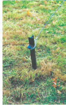
Hering und Seil Peg and Rope