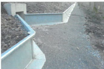
Stahl / Steel

We also supply permanent installations made of steel and concrete, with all accessories such as tunnels, stop drains and equipment for catching and counting of populations.