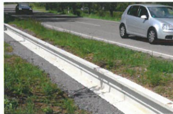
Beton / Concrete Sondervariante Laubfrosch-/Molchtauglich Special version proof for salamander and tree frog