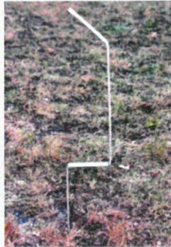
Haltepfosten, feuerverzinkt mit Spitze. Support post, galvanized.