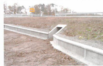
Beton / Concrete Standard