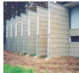
Lärmschutzwand an einer Schießanlage