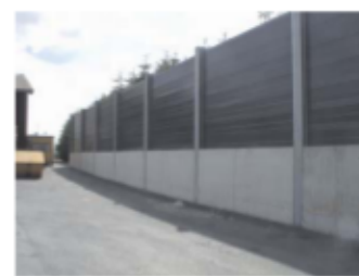
Lärmschutzwand an einem Firmenareal

Maibach Verkehrssicherheits- und Lärmschutzeinrichtungen GmbH Bogenstr. 7 CH-9001 St. Gallen Telefon +41 71 3102392 Telefax +41 71 3102393 E-Mail info@maibach-vul.ch