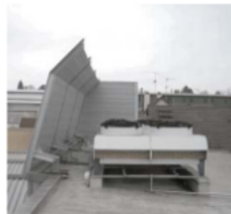
Lärmschutzwand vor Kühlaggregat

Die Elemente können reflektierend, ein- oder doppelseitig absorbierend geliefert werden.