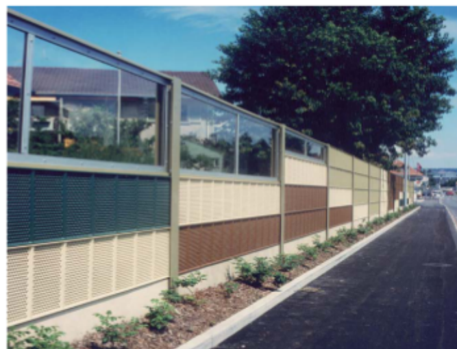
Lärmschutzwand mit Acryl an einer Spedition