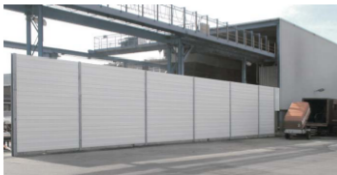
Lärmschutzwand an einer Wasser-Hochdruck-Reinigungsanlage