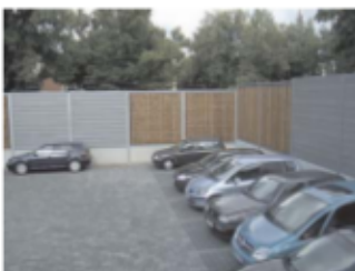
Lärmschutzwand an einem Parkplatz