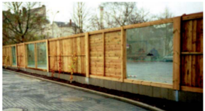
Lärmschutzwand aus Holz mit Acryl