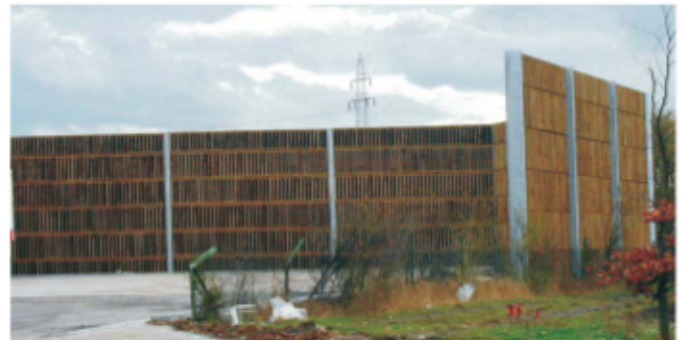
Lärmschutzwand bei einem Logistikbetrieb