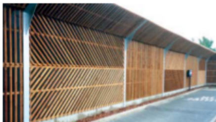
Lärmschutzwand an Parkplatzzufahrt

Die Elemente aus Holz können in unterschiedlichen Ausführungsvarianten geliefert werden. Von der preiswerten Flechtausführung bis zur Ausführung mit Halbrundlattung und rückseitiger Nut-Feder-Schalung. Die Elemente können reflektierend, ein- oder doppelseitig absorbierend geliefert werden.