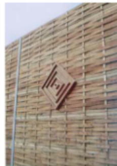
Lärmschutzwand mit Ornament