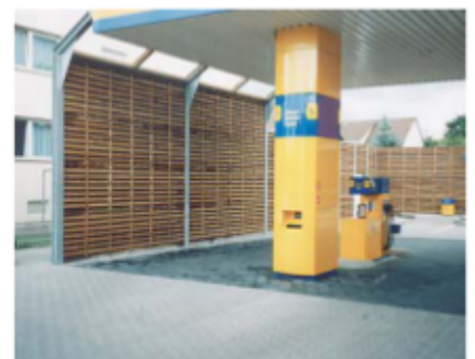
Lärmschutzwand an einer Tankstelle

Maibach Verkehrssicherheits- und Lärmschutzeinrichtungen GmbH Bogenstr. 7 CH-9001 St. Gallen Telefon +41 71 3102392 Telefax +41 71 3102393 E-Mail info@maibach-vul.ch