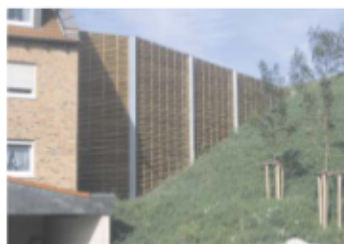
Lärmschutzwand an einer Wohnbebauung