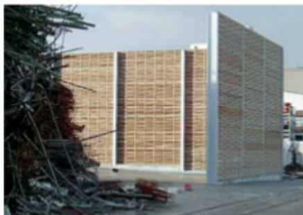
Lärmschutzwand an Recyclingbetrieb