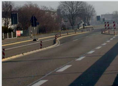
Zur Verkehrslenkung und Fahrbahntrennung To divert traffic and separate lanes