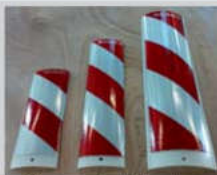
Leitfahnen / delineator: klein/ mittel/ groß/ small medium big 370 mm 530 mm 710 mm