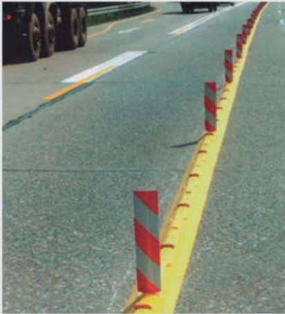
Fahrbahntrennung bei einer Autobahnbaustelle Lane marking in motorway roadworks