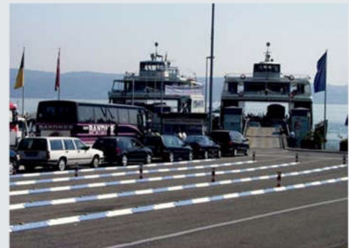
Wartespur-Trennung an einer Fähre Separation of queue-up lanes at a ferry

Die Leitschwelle ist sekundenschnell durch die Vater/Mutter-Verbindung montiert und wieder demontiert. Es kann ein Radius von mindestens 6 Grad verbaut werden. Dank speziellem Herstellverfahren keine Verformungsprobleme bei Wärme / Kälte. Durch Zugabe von Gummigranulat ist die Schwelle elastisch. Im Verbindungsbereich der Elemente werden beim Pressen zur Erhöhung der Festigkeit zusätzliche Versteifungen eingelegt. Ermittlung der optimalen, rutschfesten Form durch zahlreiche Anfahrtests.