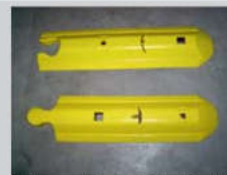
Mutter / female