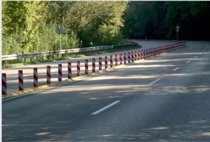
Fahrbahntrennung bei Überholverbot To prevent overtaking manoeuvres