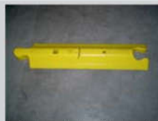
Leitschwelle / guide barrier: 1000 x 242 x 80 mm