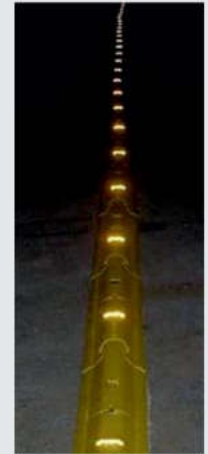
Nachtsichtbarkeit Night visibility