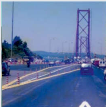
Zur Verkehrslenkung bei einer Autobahn-Zahlstelle To divert traffic in a toll station