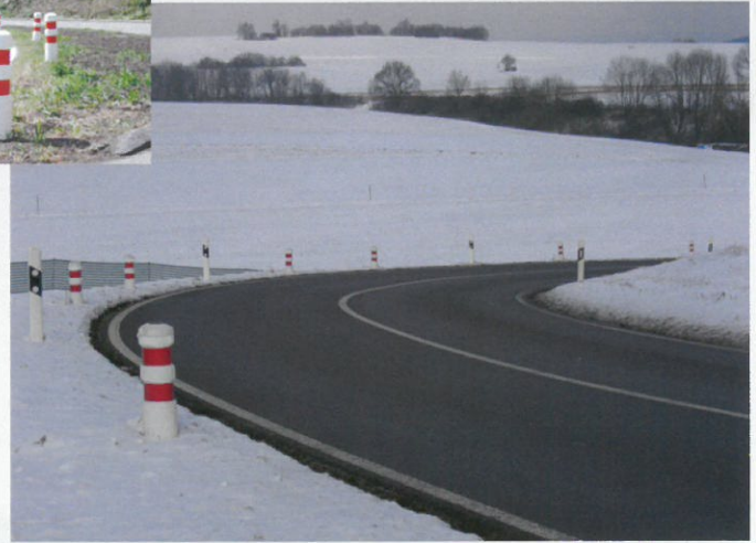
Kurven sichtbar machen (auch in der MVMot empfohlen) Indication of curves