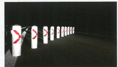
Weitere Varianten auf Anfrage / Other variants on request