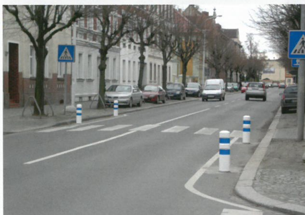
An Fußgängerüberwegen gemäß den Empfehlungen zur Gestaltung von Fußgängerwegen Richtlinien RFGÜ 2001 Pedestrian crossings