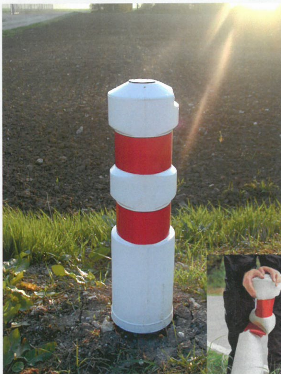
Balisette / Soft bollard

Soft bollard The new way of indicating curves and obstacles