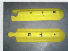
Anfangs-/Endstück / Endelement: 800 x 242 x 80 mm