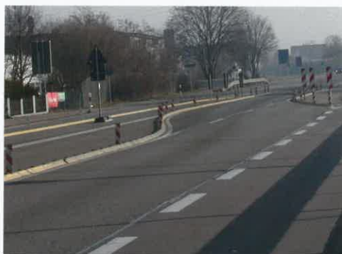
Zur Verkehrslenkung und Fahrbahntrennung To divert traffic and separate lanes