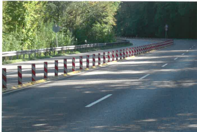
Fahrbahntrennung bei Überholverbot To prevent overtaking manoeuvres