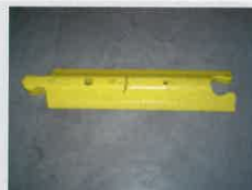
Leitschwelle / guide barrier: 1000 x 242 x 80 mm