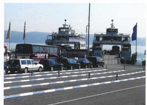
Wartespur-Trennung an einer Fähre Separation of queue-up lanes at a ferry

Die Leitschwelle ist sekundenschnell durch die Vater/Mutter-Verbindung montiert und wieder demontiert. Es kann ein Radius von mindestens 6 Grad verbaut werden. Dank speziellem Herstellverfahren keine Verformungsprobleme bei Wärme / Kälte. Durch Zugabe von Gummigranulat ist die Schwelle elastisch. Im Verbindungsbereich der Elemente werden beim Pressen zur Erhöhung der Festigkeit zusätzliche Versteifungen eingelegt. Ermittlung der optimalen, rutschfesten Form durch zahlreiche Anfahrtests.