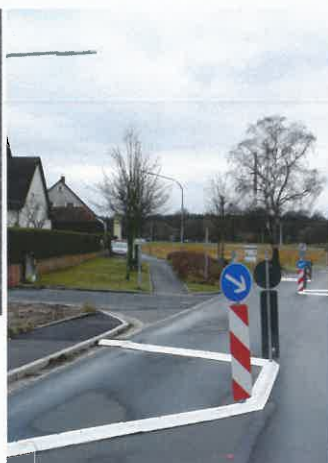
Winkelemente in einer Tempoberuhigungszone Corner elements in a residential zone

Winkelement - individuell auf Maß gefertigt Corner element - made individually according to request