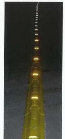
Nachtsichtbarkeit Night visibility