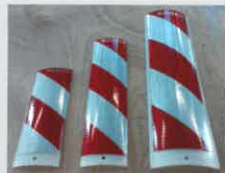
Leitfahnen / delineator: klein/ mittel/ groß/ small medium big 370 mm 530 mm 710 mm