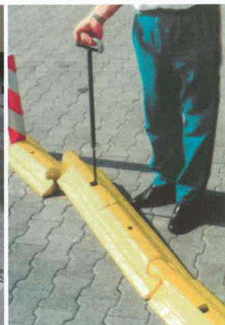
Problemloser Austausch mit Spezialhebewerkzeug Easy removal with special tool