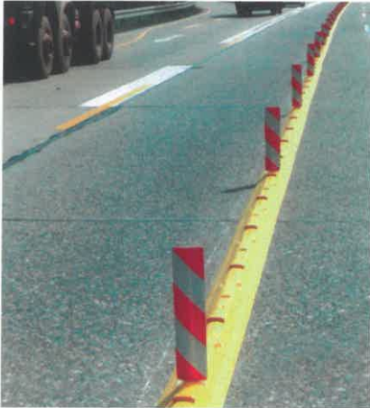
Fahrbahntrennung bei einer Autobahnbaustelle Lane marking in motorway roadworks