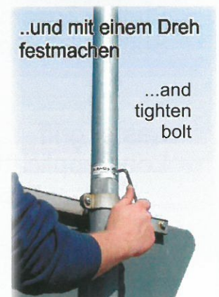
..und mit einem Dreh festmachen